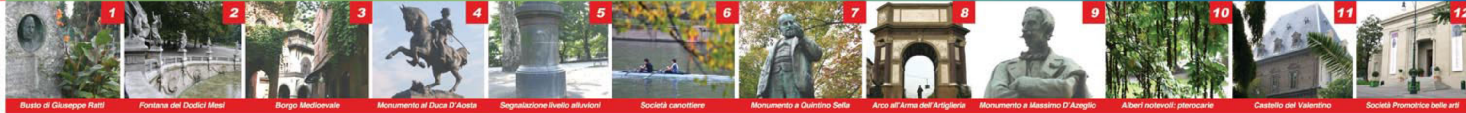
1 Busto di Giuseppe Ratti 2 Fontana del Dodici Mesi 3 Borgo Medioevale 4 Monumento al Duca D'Aosta 5 Segnalazione livello alluvioni 6 Società canottiere 7 Monumento a Quintino Sella 8 Arco all'Arma dell'Artiglieria 9 Monumento a Massimo D'Azeglio 10 Alberi notevoli: pterocarie 11 Castello del Valentino 12 Società Promotrice belle arti

Pro Natura Torino ONLUS +39 011.50.96.618