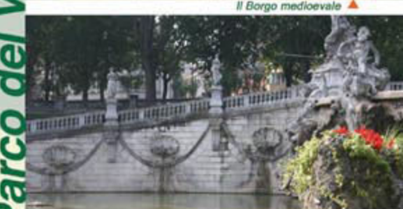
La fontana del Dodici Mesi