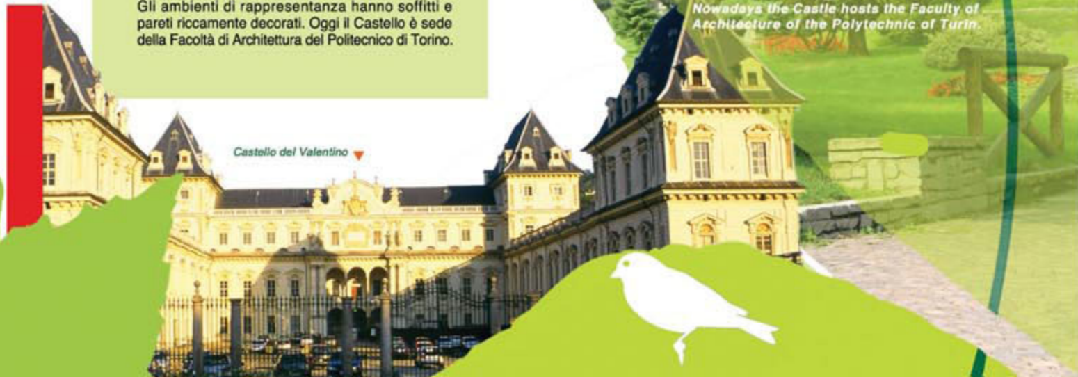
Castello del Valentino