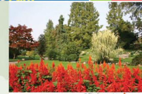
Il Giardino roccioso