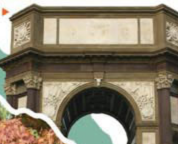
Monumento all'Arma dell'Artiglieria

The most important building in the park is doubtlessly the Castle, built between 1621 and 1660 for Royal Madam Cristina, widow to King Vittorio Amedeo I. The french-styled project shows in the schist covered highly inclined roofs; the decorations of ceilings and walls are among the finest ever seen. Nowadays the Castle hosts the Faculty of Architecture of the Polytechnic of Turin.