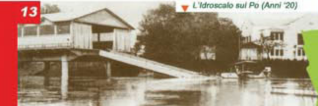
13 L'Idroscalo sul Po (Anni '20)