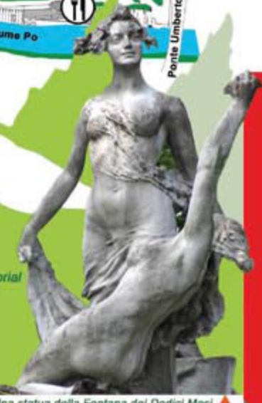
Una statua della Fontana del Dodici Mesi