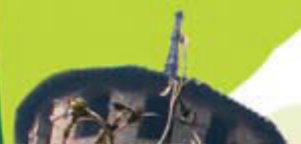
Borgo medioevale, la Rocca