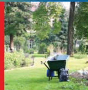
Viste dell'Orto botanico

The village was built between 1882 and 1884 for the General Expo held in Turin a few years later. The general layout is mainly inspired to the well-known castles in Piedmont and Aosta Valley; the project was so successful that the city administration decided to buy the village and make it a museum instead of dismantling it as planned. Even though the castle reported some serious damage during WWII, from 1995 to 2004 an intensive restoration brought the area back to its ancient splendour, enhancing the area with a nice medieval garden and a promenade along the walls.