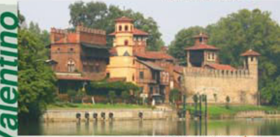
Il Borgo medioevale