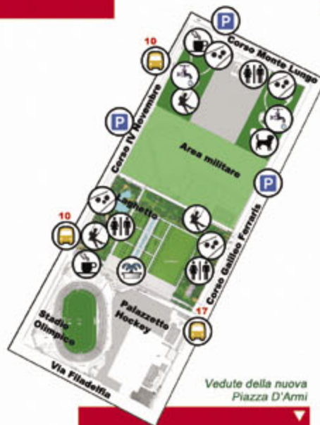
Vedute della nuova Piazza D'Armi