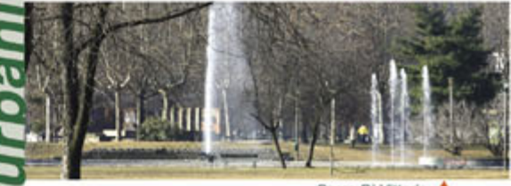
Parco Di Vittorio ▲