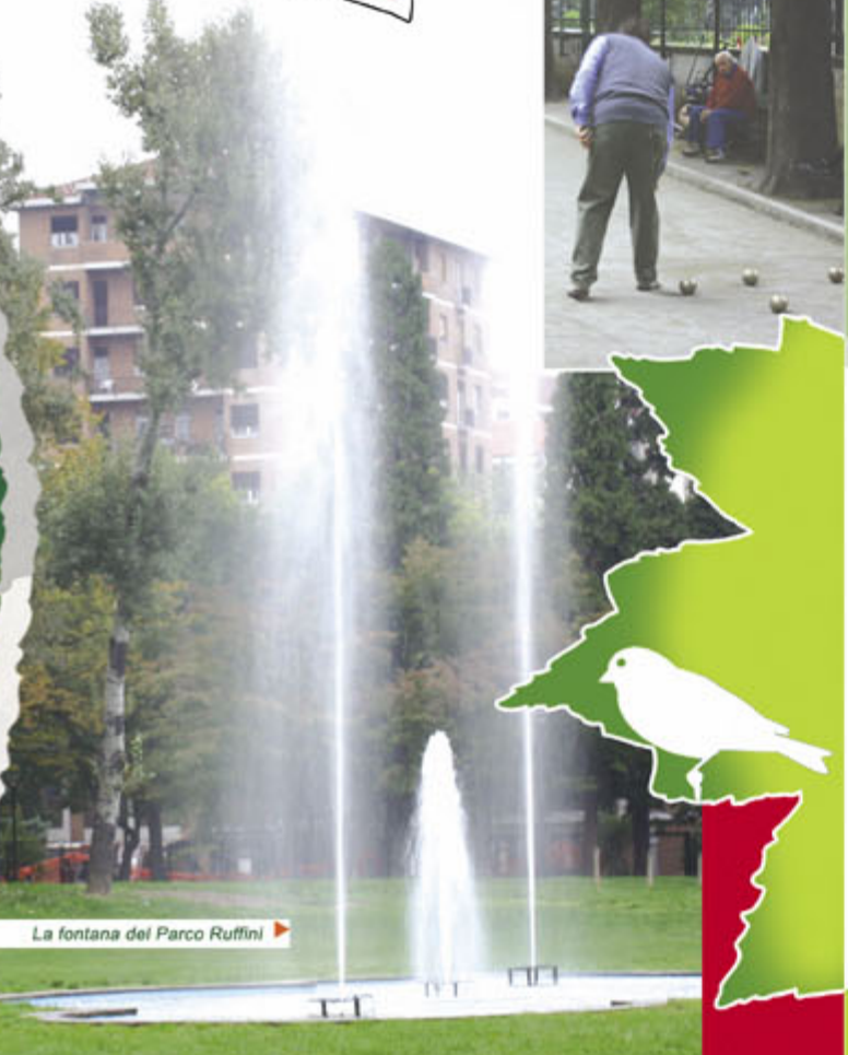
La fontana del Parco Ruffini ▶