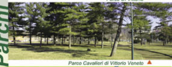
Parco Cavalieri di Vittorio Veneto ▲