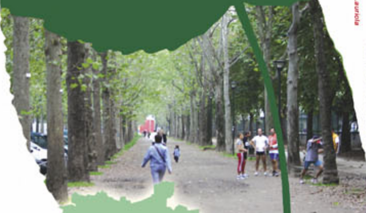
Un viale del Parco Ruffini ▲

concepti & design: www.comunicoinfo.it