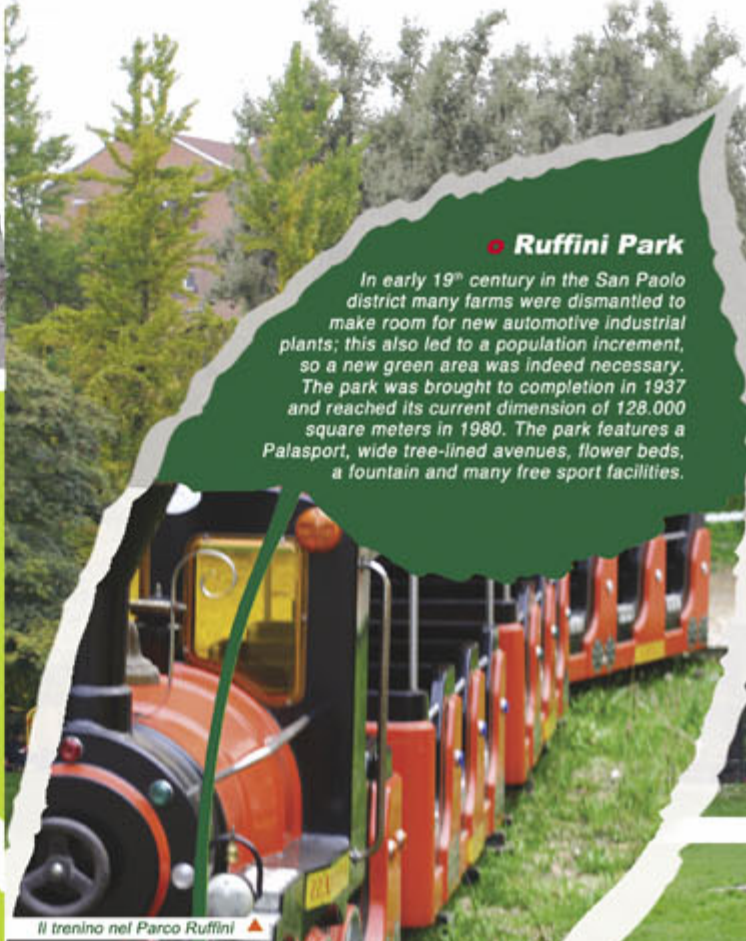
Il trenino nel Parco Ruffini ▲