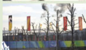
Nuovi piantamenti al Parco Di Vittorio