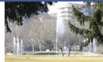
La fontana del Parco Di Vittorio

The 152.000 square meters wide area was completed in 1974 and totally restored for the 2006 Olympics, being adjacent to the Olympic Stadium, and closed to motor traffic. The area hosts many high level sports facilities and a humid zone where bushes and over 1.500 tree live.