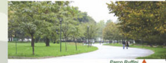
Parco Ruffini ▲