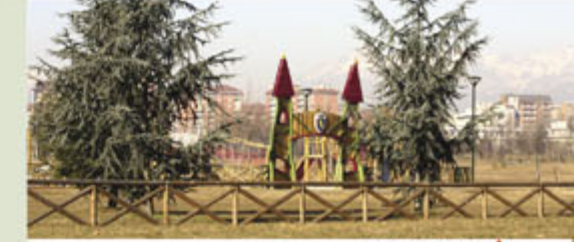
Parco Colonnetti ▲