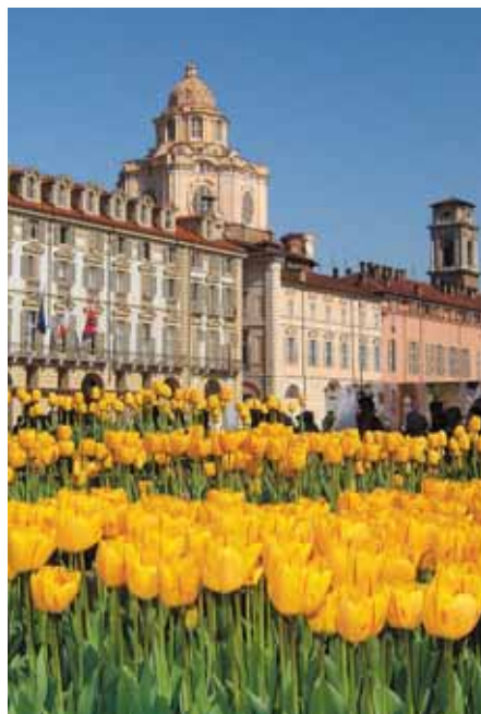
La varietà di tulipani "Olympic Flame", selezionata per i Giochi invernali.

verde circoscrizionale oppure in parchi di impronta moderna.