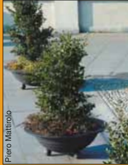
Fioriera in ghisa con piante arbustive.