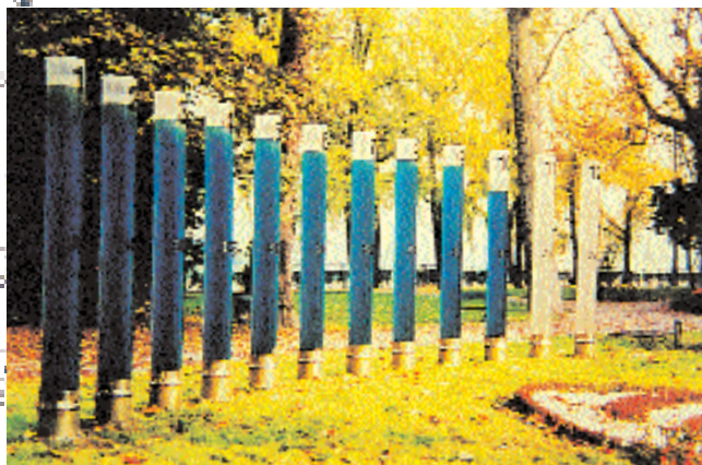
L'orologio ad acqua, una delle attrazioni del Parco dello Zoo.