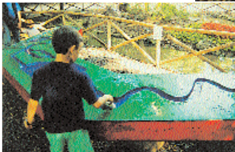
Il tavolo-gioco con il serpente d'acqua. A destra, la fontana musicale con le note a forma di pesce per lo spartito di Ravel.