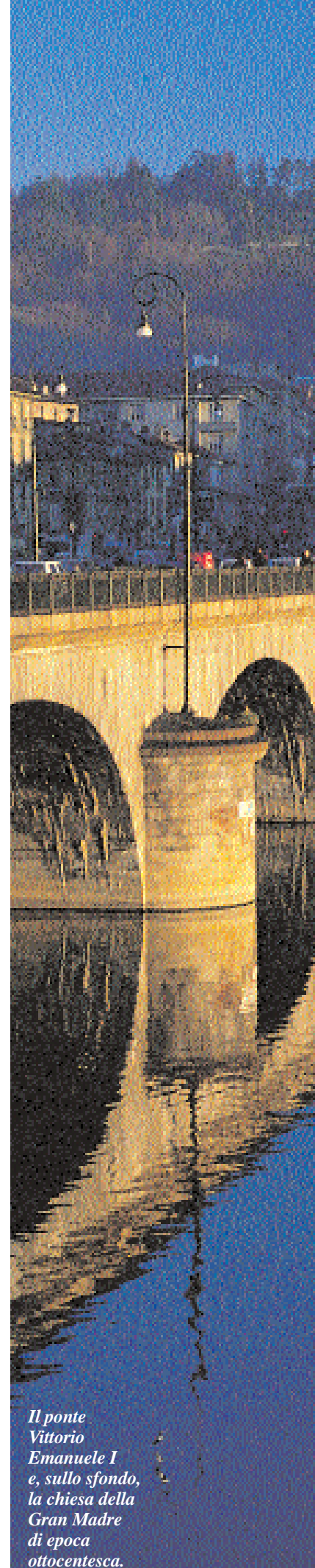
Il ponte Vittorio Emanuele I e, sullo sfondo, la chiesa della Gran Madre di epoca ottocentesca.

L'attenzione progettuale di Corona Verde è indirizzata alla definizione di un quadro organico di possibilità di fruizione offerta dal territorio, differenziata e verificata