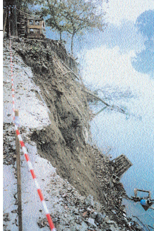
Fenomeni di erosione spondale che, pur limitati, mettono a rischio attività e abitazioni impropriamente ubicati a ridosso del Po.