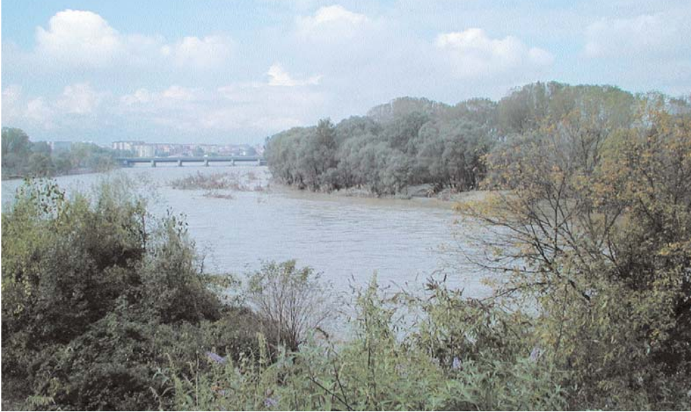
Esondazione del Fiume Po nel tratto del Parco del Meisino.

ne dello stesso Piano sono, a questo proposito, esplicitate nell'articolo 14: "Le zone ad utilizzo agricolo e forestale all'interno delle Fasce A e B sono qualificate come zone sensibili dal punto di vista ambientale ai sensi delle vigenti disposizioni dell'U.E. e possono essere soggette alle priorità di finanziamento previste a favore delle aziende agricole insediate in aree protette da programmi regionali attuativi di normative ed iniziative comunitarie, nazionali e regionali, finalizzate a ridurre l'impatto ambientale delle tecniche agricole e a migliorare le caratteristiche delle aree coltivate". Infine, l'articolo 10 prevede che l'attuazione del Piano venga realizzata attraverso programmi triennali di intervento, anche con il concorso di altri enti, mediante accordi di programma e tramite l'istituto della Conferenza dei Servizi.