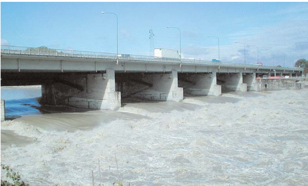
Le acque in piena del Po, qualche giorno dopo l'alluvione.

renti agli interventi di risanamento successivi a eventi alluvionali che, applicando tali norme, potrebbero essere realizzati solo nell'arco di decenni anziché servire da ripristino di situazioni di emergenza. Ecco che allora sarebbe opportuno poter considerare gli interventi in ambito fluviale alla stessa stre-