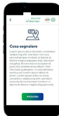
Step 1: scheda informativa generale del servizio

La segnalazione ambientale: i cittadini possono segnalare situazioni che necessitano di un intervento