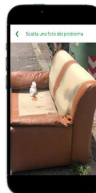
Step 3: foto della segnalazione e contestuale recupero delle coordinate geografiche