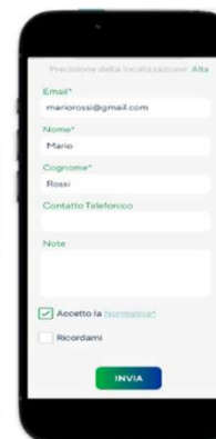
Step 4: dati segnalazione