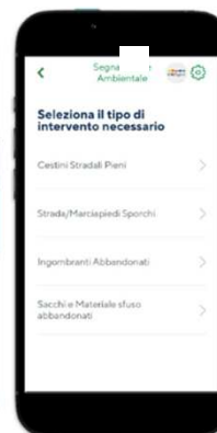
Step 2: scelta tipologia di segnalazione