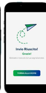
Step 5: feedback all'invio