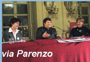
Lo strano caso di via Parenzo

Che soddisfazione. Tenere fra le mani il fotoromanzo, sfogliarlo, ritrovare le facce, ripensare a quel caldo rovente di luglio, quando si sono fatte le foto. Si ride, riguardandosi, ma si è anche orgogliosi. Poi l'idea: non è che si può solo tenerlo per noi, è troppo bello! va presentato, fatto girare, non solo in quartiere.