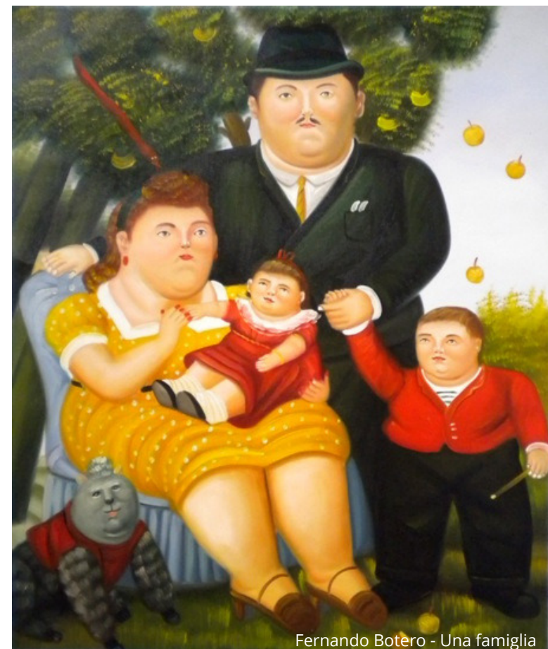
Fernando Botero - Una famiglia