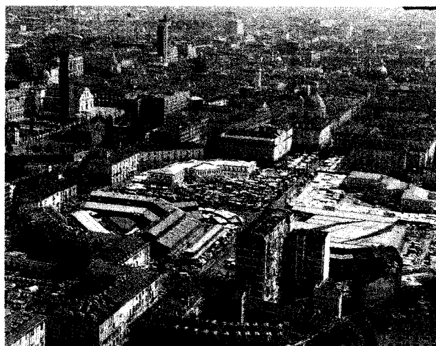
Punti di vista Dalla mongolfiera si possono cogliere punti di vista della città originali, in particolare l'area aulica del Duomo, della cappella della Sindone e le piazze del centro