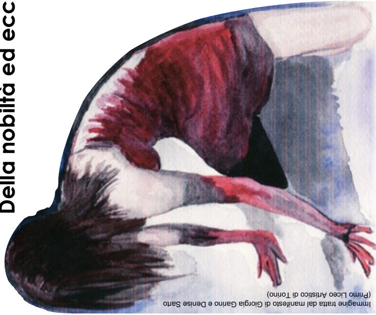
(Primo Liceo Artistico di Torino) Immagine tratta dal manifesto di Giorgia Gamro e Denise Sarro

c.so Orbassano, 200 tel. 011 4438604 orario: dal lun. al ven. 8.15 - 19.55 sab 10.30-18.00