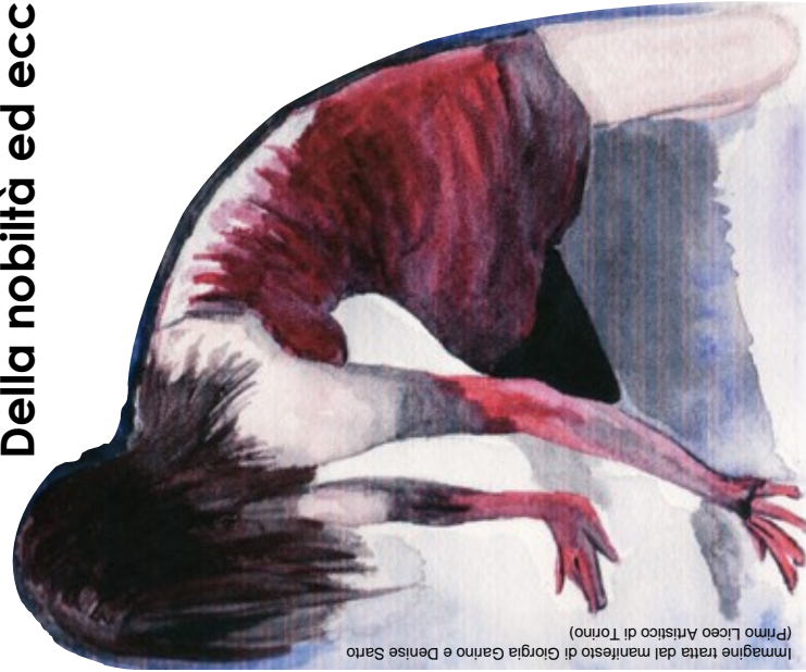
(Primo Liceo Artistico di Torino) Immagine tratta dal manifesto di Giorgia Gamro e Denise Sarro

c.so Orbassano, 200 tel. 011 4438604 orario: dal lun. al ven. 8.15 - 19.55 sab 10.30-18.00