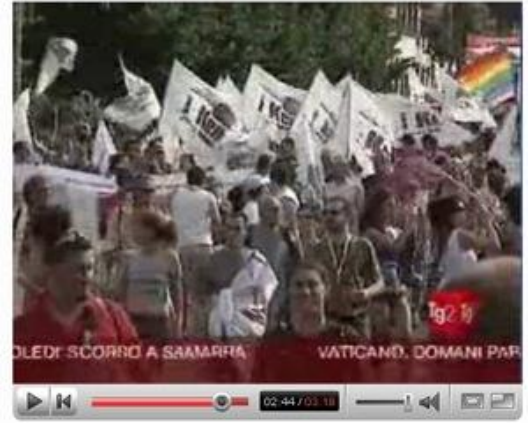
tg2 gay pride roma 2007

You Can wash away the Prejudice www.i-ken.org