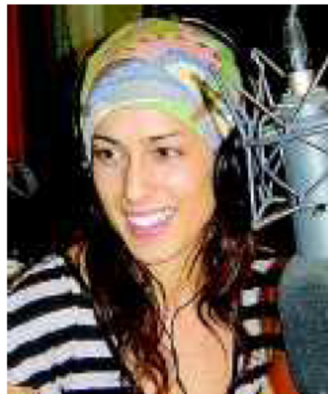
Syria alla Fnac il 23

La settimana alla Fnac di via Roma 56 comincia invece venerdì 17 alle 18 con la presentazione del cofanetto «Prog exhibition», che raccoglie in sette cd e quattro dvd il memorabile concerto