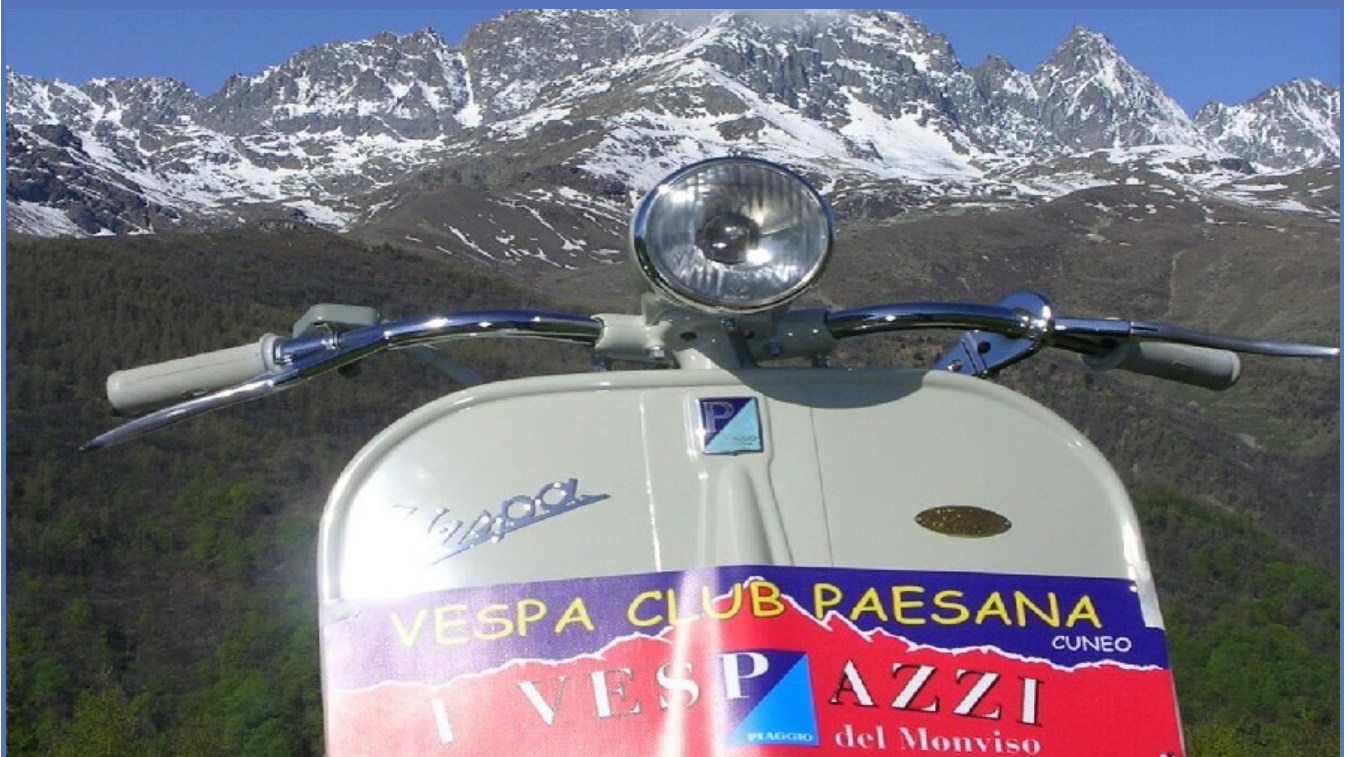
Paesana, i "Vespazzi del Monviso" inseguono una passione lunga 70 anni