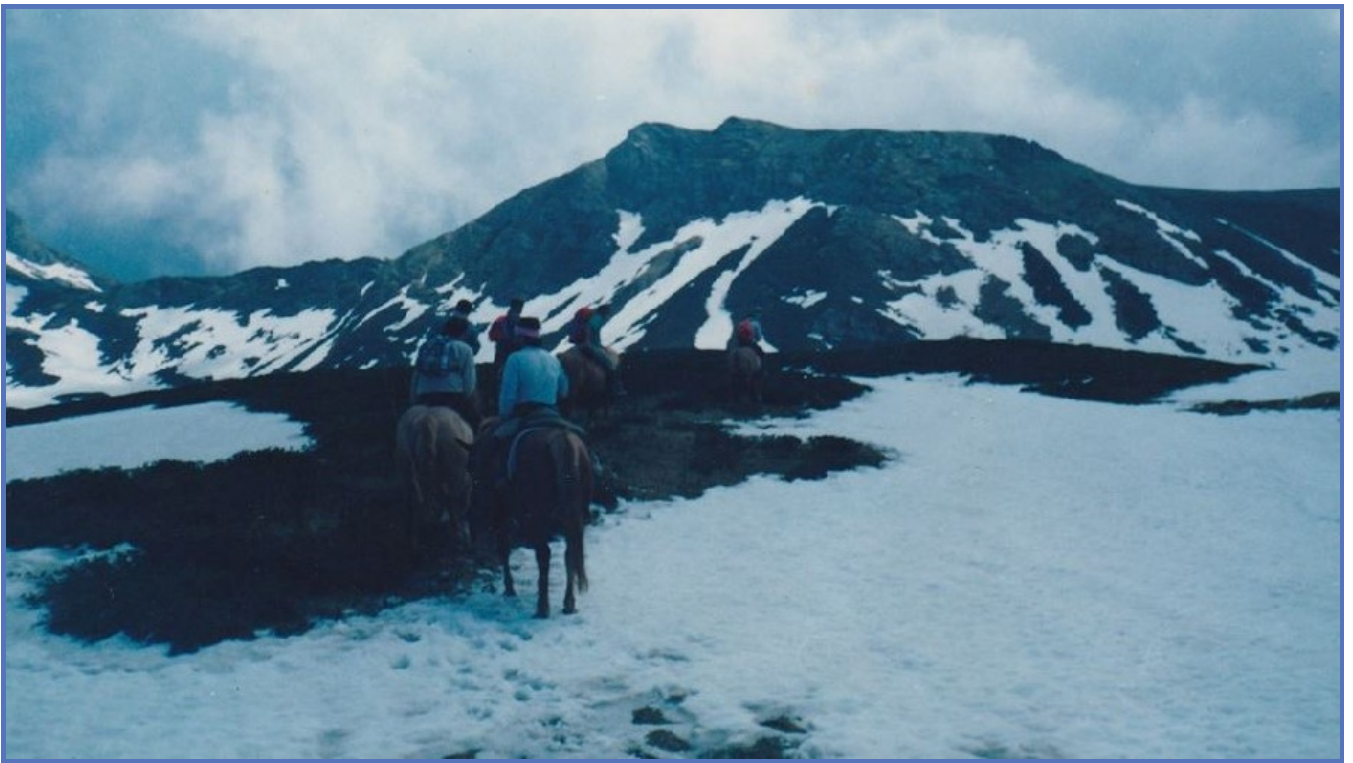
Dalle Alpi al mare, la Via Marenca si percorre al galoppo trent'anni dopo