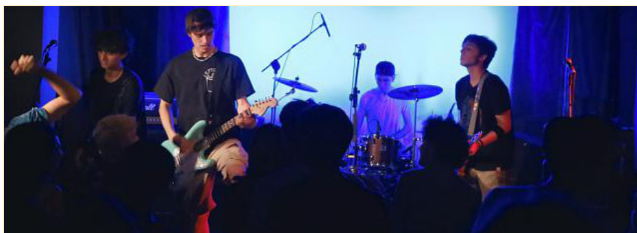
Un momento della finale 2017 di Pagella non solo Rock

Anche quest'anno il Comune di Torino promuove e organizza il concorso musicale Pagella non solo Rock , un progetto per i musicisti under 23 della nostra città, una vetrina che ormai da diversi anni dà la possibilità di ottenere premi e riconoscimenti in ambito musicale. La competizione rappresenta un'ottima occasione per farsi conoscere e aumentare la propria visibilità nel panorama piemontese. Attenzione però, c'è tempo fino a lunedì 26 febbraio per presentare la domanda di adesione.