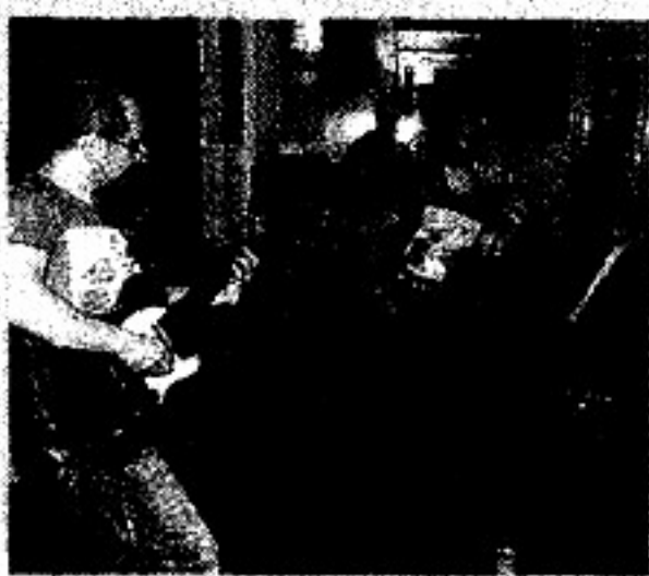
● Al Neruda Lelectrik Quartet

CONCORSI. Sono come sempre quattro le giovani band in gara per il turno settimanale del concorso «Torino Sotterranea». Martedì 14 l'appuntamento è all'Xd di via Po 46 con 9000DOL, F.I.M., Drum Liber e Mi Son Tagliato Con La Carta. Live alle 22, si entra con 3 euro. Nel frattempo è uscito il bando per l'iscrizione a un'altra importante kermesse dedicata alle nuove leve del rock cittadino, «Pagella non solo Rock». Il termine è il 20