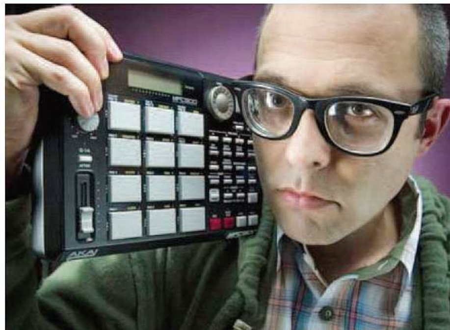
Allo Spazio 211 di via Cigna sabato 2 lo special guest di «Pagella Rock» è Frankie Hi-Nrg Mc

Informazioni al sito www.spazio211.com e al numero 011/1970.59.19. [P. F.]