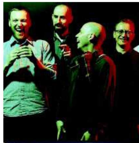
Gli scozzesi Mogwai aprono il cartellone il 12 luglio