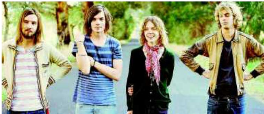
I giovanissimi australiani Tame Impala, sul palco col supporto di Movie Star Junkies e Orange

ra di mercoledì 13, preceduta dall'eccellente chitarrista subalpino Paolo Spaccamonti, introduzione perfetta allo stile della nuova dama del flamenco punk blues britannico. Specialità di Spaziale è intercettare le star sul punto di diventare tali, quando ancora navigano nel mare indipendente ma già con la prua in area grande business. Due esempi su tutti restano i passaggi in Barriera di Milano dei Gossip di Beth Ditto e dei Vampire Weekend. Quest'anno tocca a lei, un solo disco finora pubblicato, intitolato «Anna Calvi», e un culto dilagante in rete. La cantautrice e chitarrista di origine italiana annovera tra i suoi fan Nick Cave e Brian Eno, ha conquistato le riviste di moda e di costume, è stata invitata a Cannes, cita tra i propri numi tutelari Maria Callas e Jimi Hendrix. È insomma personaggio pop a tutto tondo, e con il suo stile graffiante, cattivo, aggressivo come il rock alternativo e sensuale come il flamenco domina con autorità i palchi dei festival più prestigiosi d'Europa. Assistere al doppio concerto costa 15 euro. Altri leader del cartellone attesi in settimana sono gli scozzesi Mogwai, cari al pubblico torinese fin dai tempi delle prime apparizioni al Barrumba e incaricati di aprire martedì 12 l'intera manifestazione. Mischiando chitarre ed elettronica nell'orizzonte in chiaro-scuro del post rock, filone di cui è a ragione considerata tra i leader, la band di Glasgow ha superato ormai i tre lustri di attività.