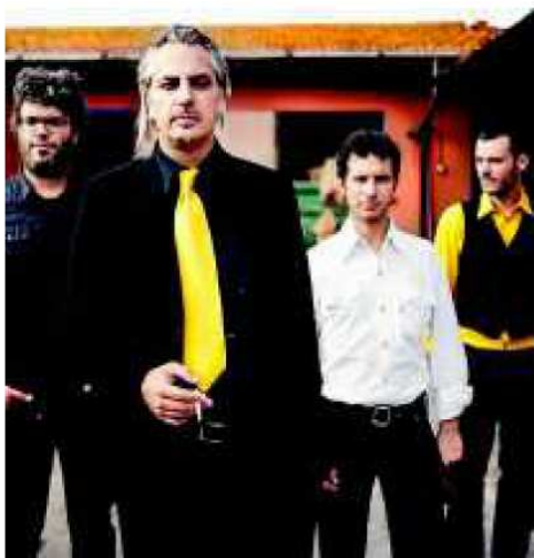
Il concerto di Paolo Benvegnu' in programma giovedì 14

➔ SUL PALCO DI VIA CIGNA 211 ANCHE LE ECCELLENZE NAZIONALI PAOLO BENVEGNÙ, CALIBRO 35 E ONE DIMENSIONAL MAN