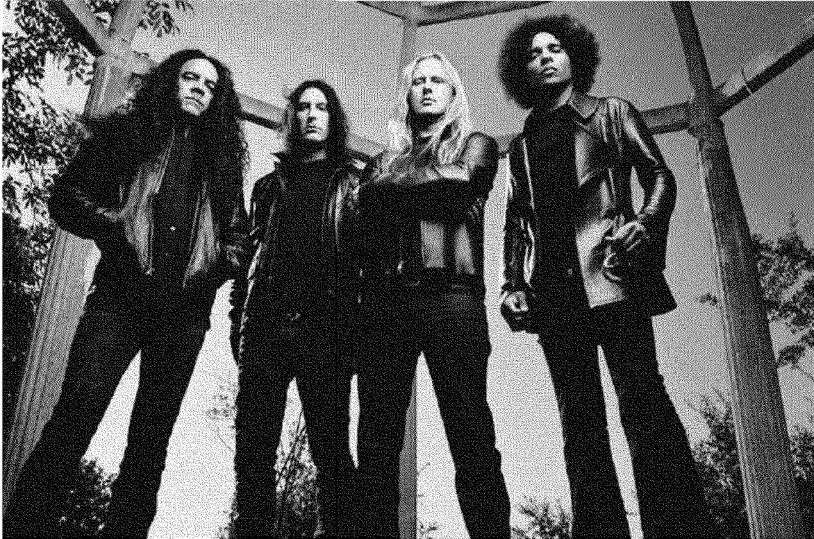
Gli statunitensi Alice In Chains inaugurano Colonia Sonora