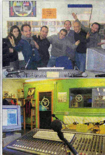
PROTAGONISTI E LUOGHI di Radio Flash.