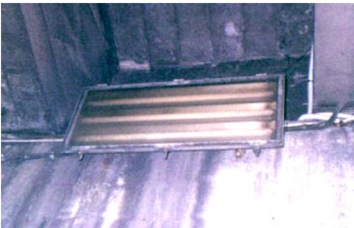
Lampada da parete con tubi al neon (anni '60/'70)

Se si volesse attribuire ad ogni periodo storico una tonalità d'illuminazione, con particolare riferimento all'illuminazione pubblica, si potrebbe rapidamente dire che l'800 è stato il secolo del lume a petrolio e dell'impianto a gas, mentre il '900 è stato quello della lampadina ad incandescenza e del tubo al neon. Quest'ultimo rappresenta significativamente l'epoca industriale metropolitana degli anni '60/'70 del secolo scorso.