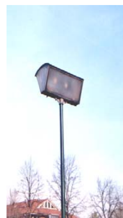
Lampada ‘60/’70, in via di eliminazione

I grandi impianti degli anni ‘60/’70, dal design fra il retro ed il modernariato , hanno una spiccata “personalità” e restano facilmente impressi, rispetto ad altre sorgenti