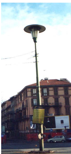
Grande impianto ‘60/’70, pressoché scomparso.

Si potrebbero dunque salvare alcuni impianti, trasferendoli in aree dedicate e pertinenti?