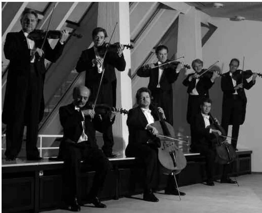
Otetto d'archi dei Berliner Philharmoniker

Domenica 26 ottobre Conservatorio ore 16,30