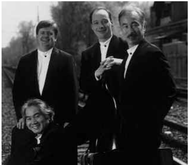
Quartetto di Tokyo