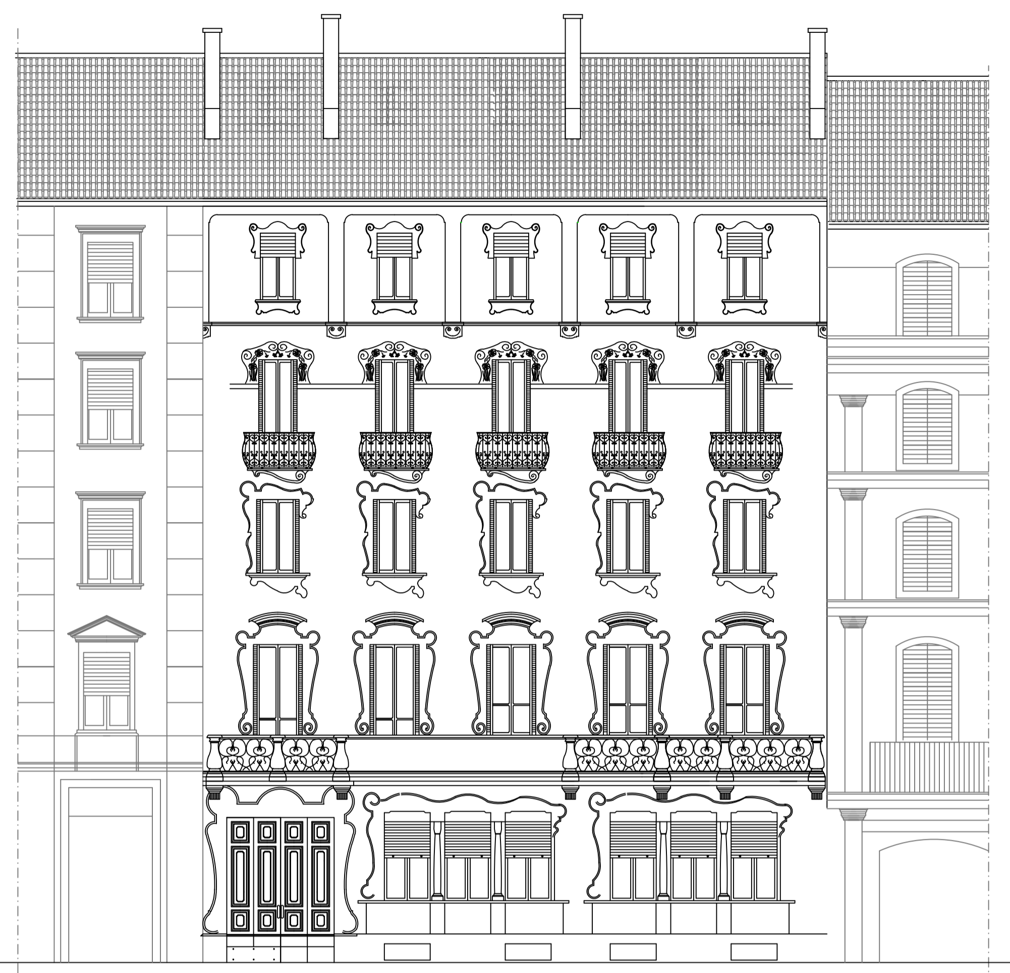
PROSPETTO LATO STRADA Stato di Fatto