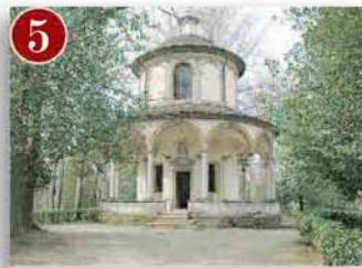
Sacro Monte di Orta (No)