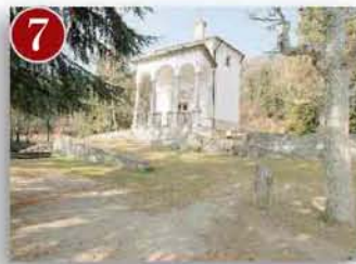
Sacro Monte di Ghiffa (Vco)