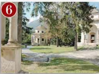
Sacro Monte di Domodossola (Vco)