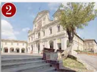
Sacro Monte di Crea (AL)

Eccolo, spiegato dal direttore artistico Claudio Montagna, il senso della performance itinerante che sposa arte, cultura e riflessione, che andrà in scena al Sacro Monte di Belmonte (e uno dei simboli del Canavese) nelle serate del 1° e del 2° e 3° luglio. I notturni al Sacro Monte nascono in ricorrenza del riconoscimento del sito a Patrimonio dell'Umanità Unesco avvenuto il 3 luglio 2003: «Per dire al resto del mondo cos'è Belmonte - racconta ancora il regista Montagna - useremo la meraviglia e lo stupore: stati d'animo che nasceranno da una performance itinerante fatta di teatro, danza contemporanea, pittura, artigianato, scultura, canto, musica e arti circensi: lassù, le emozioni di uno spettacolo sotto le stelle, e la sola guida del racconto, si potrà riconquistare lo spirito del Sacro Monte, o meglio dei sacri monti: luoghi in cui si viaggia verso altre terre, lontane eppure così vicine da farsi terre dello spirito». Gli artisti, 55 «viandanti attori» che accompagneranno i partecipanti alla notte dello spirito, si