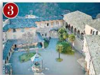
Sacro Monte di Varallo (Vc)