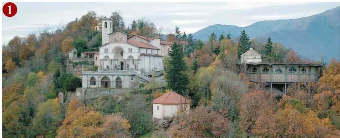
Il Sacro Monte di Belmonte

Come arrivare Per raggiungere il Sacro Monte saranno messe a disposizione navette con partenza da Cuornè e Pertusio dalle 19 alle 21.15. Dalle 19 alle 24 la strada per il Sacro Monte sarà chiusa al traffico all'altezza della frazione Pemonte. Ma sarà possibile salire a piedi