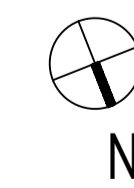
PIANTA PIANO TERRA 1:100