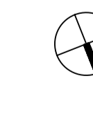
PIANTA PIANO 1° 1:100