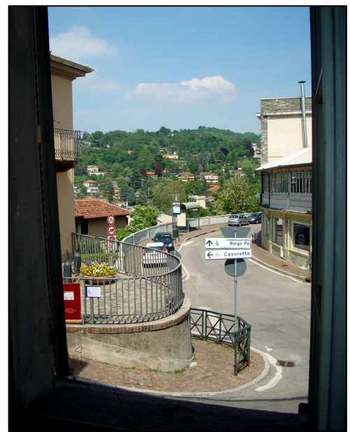
Vista verso la str. comunale di Cavoretto