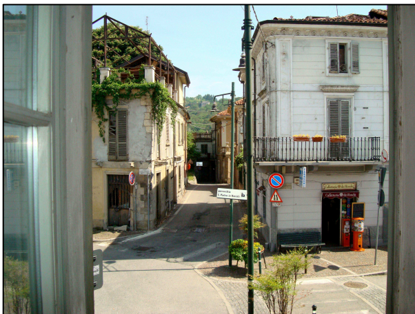
Vista verso la piazza Freguglia