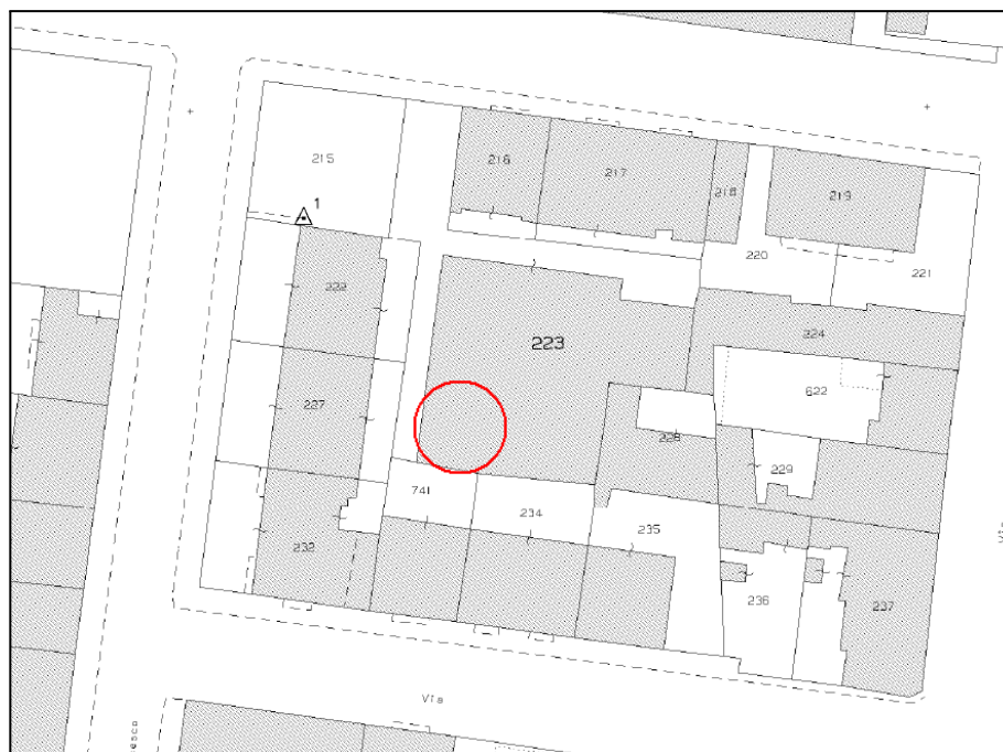
Foglio 1169, particella 223 - Stralcio planimetria C.T - Non in scala

Si riportano, a mero titolo informativo, le planimetrie catastali depositate presso l'Agenzia del Territorio che non sono da intendersi quale stato legittimato.