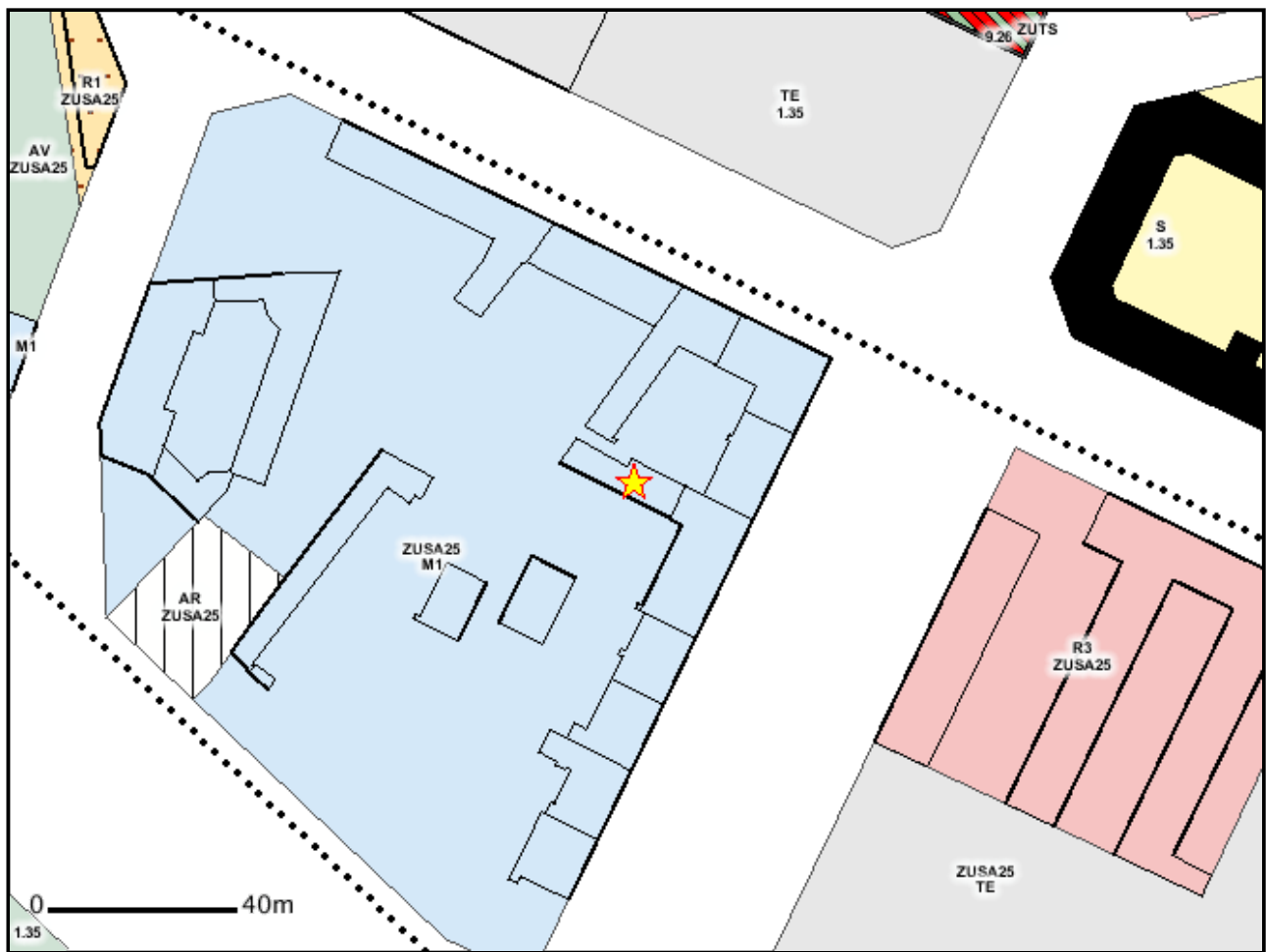
Inquadramento catastale su carta tecnica