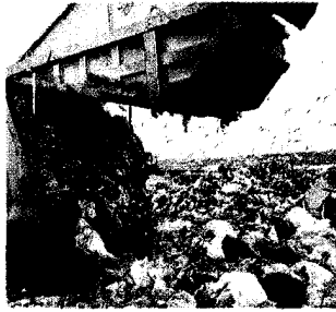
Un camion al lavoro in discarica

Nasi ancora tappati nella zona nord-ovest di Torino e, ancor di più verso Druento, Collegno e Pianezza, per il fetore che da mesi aleggia nell'aria. Le zaffate non si fermano, nonostante stia per scadere il mese di tempo che la Provincia aveva dato al principale responsabile, l'impianto di compostaggio Punto Ambiente di Druento - pena la revoca dell'autorizzazione - per mettersi in regola con le prescrizioni sul contenimento degli odori. Da metà settembre, un centinaio le segnalazioni all'Arpa. «L'impianto ha 15 giorni per comunicarci gli interventi effettuati, poi torneremo a verificare se i problemi si sono risolti», spiega Roberto Ronco, asses-