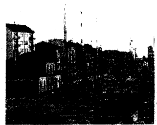
Lavori alla Stazione Dora

Un monumento sul Passante per non dimenticare il passato «ferroviario» di corso Principe Oddone. La proposta è nata sul web ma si è concretizzata con una raccolta firme inviata alle Circoscrizioni 4 e 7. L'obiettivo evitare che la rivoluzione urbanistica del Passante ferroviario abbatta il ricordo lungo oltre 150 anni della linea storica Torino-Novara-Milano. Gli utenti del forum di skyscrapercity.com hanno proposto la conservazione delle colonne portanti chiodate della travatura dei binari sopra via Don Bosco per collocarle in un'aiuola o rotonda sul nuovo viale che presto nascerà. Una proposta attenta al passato di una città che a col-