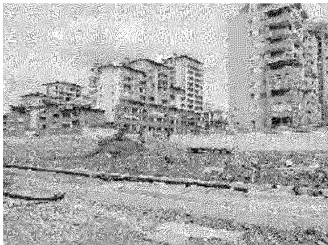
Lavori in corso davanti alle nuove case di Spina 3

so liberarlo dai cumuli di terra industriale inquinata che li vengono trattati e bonificati» hanno confermato lo scorso lunedì i tecnici del Comune durante un sopralluogo.