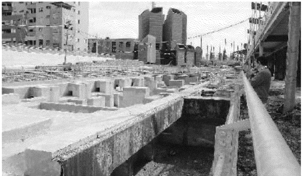
Una delle aree che verranno trasformate in parco entro i primi mesi del 2011

Intanto però è certo che almeno uno dei lotti, l'area Valdocco Nord, sulla sponda sinistra del fiume, non verrà realizzato in tempo per le celebrazioni: «Troppo laborio-