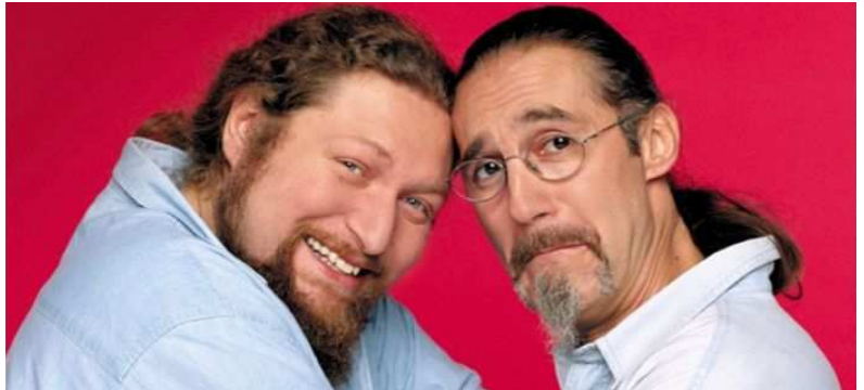
Il duo comico i Mammuth