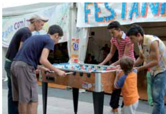
Ragazzi impegnati in una partita a calcetto