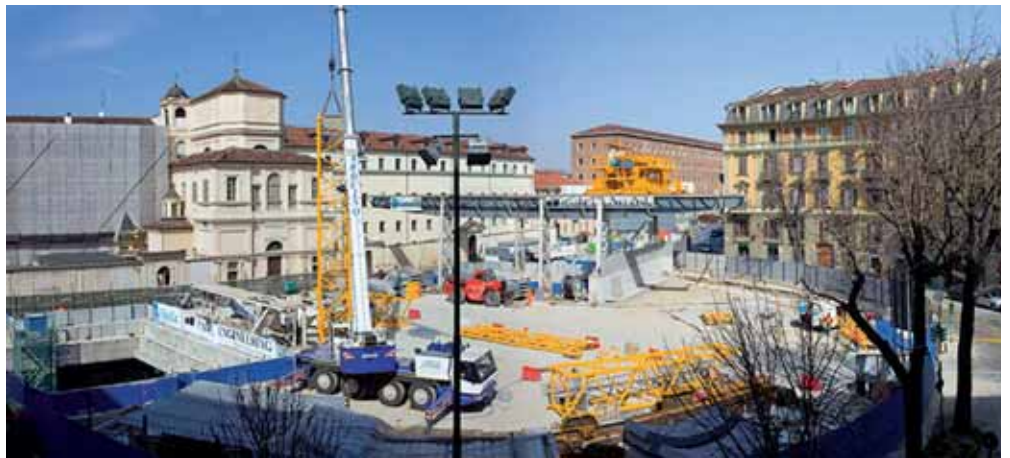
Il cantiere della Metro trasforma il quartiere.

Il contesto locale, che pure sorprende ogni volta per la vitalità e per la voglia di fare e superare le difficoltà, registra una situazione generale di scarsa crescita e di progressivo impoverimento, in cui restano senza soluzione problemi economici e strutturali. Il commercio al dettaglio di piccola e media dimensione è alle prese, ormai da anni, con cali di fatturato e problemi di liquidità che spesso limitano la crescita delle attività. La pressione fiscale è elevata e la capacità di spesa del consumatore medio diminuisce a causa dell'aumento dei costi dei beni primari, dall'affitto al