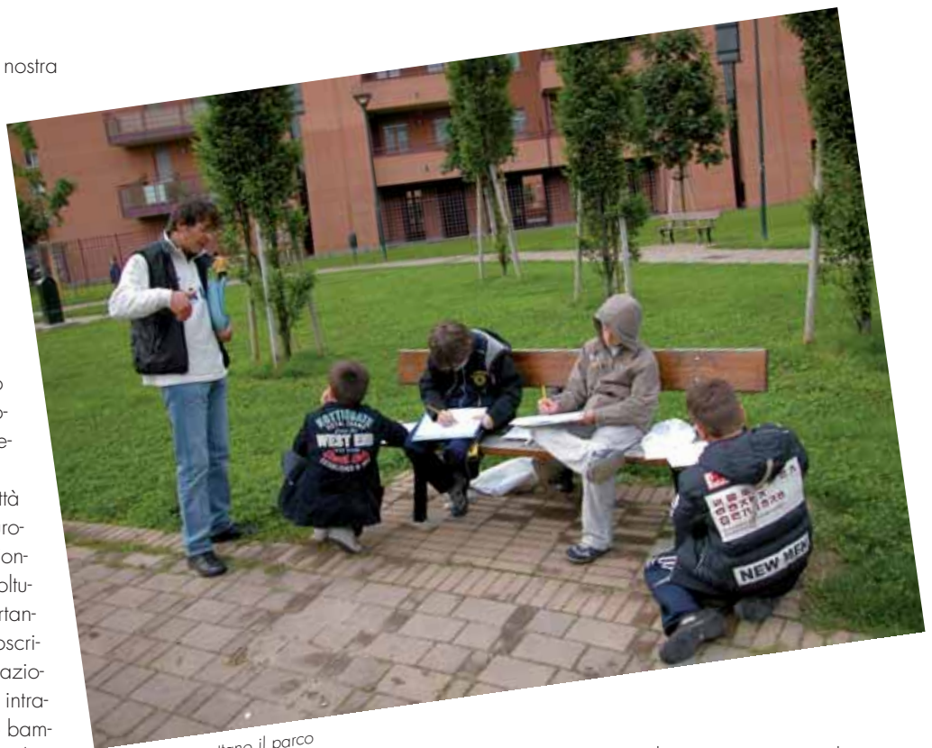
I bambini progettano il parco

A giugno la nostra Città ospiterà i Campionati Europei di Tree Climbing e il Congresso Europeo di Arboricoltura. In attesa di questi importanti appuntamenti, la Circoscrizione, grazie alla collaborazione dell'ufficio tecnico, ha intrapreso iniziative rivolte alle bambine e ai bambini delle scuole. La prima iniziativa, che si è svolta con la scuola materna di via Lugaro, ha interessato tutti i bambini che frequentano l'ultimo anno completando un lavoro svolto precedentemente dalle insegnanti sul mondo degli insetti. Sono state distribuite piantine di viole destinate ad allestire delle ciotole e con i bimbi si è svolta l'attività didattica di preparazione delle tazze. La seconda iniziativa si sta svolgendo con la classe terza B della scuola elementare Alessandro Manzoni, che partecipa al progetto "L'aiuola Donatello, un giardino per i bambini". I piccoli hanno realizzato una prima mappatura delle essenze vegetali presenti in tale area e hanno imparato a interrare una