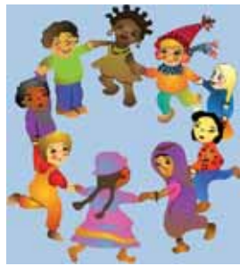
giovani nati e cresciuti nel nostro Paese, la generazione "2G"

Sono 3 milioni e 700 mila gli immigrati regolari in Italia, pari al 6,2% della popolazione complessiva (nell'UE è il 5,6%). Gli ultimi studi parlano di oltre 4 milioni d'immigrati regolari in Italia. In quest'articolo, non voglio entrare in polemica con nessuno, ma affermo che questi uomini e queste donne, che hanno lasciato i loro cari e la patria, hanno portato più di qualsiasi altra cosa ricchezza economica e culturale. Oggi, invece di litigare o lanciare allarmismi infondati sulla sicurezza, che alimentano solo l'accentuarsi di fenomeni di razzismo e di discriminazione, dobbiamo puntare sull'integrazione della seconda generazione. Vengono definite seconde generazioni "G2" i figli degli immigrati nati in Italia o giunti prima dei sei anni. La loro presenza diventa visibile nelle scuole e successivamente, nella formazione professionale e sul mercato giovanile del lavoro, diventando così parte integrante della complessa problematica giovanile del Paese. E' una sfida strategica trovare una politica mirata all'integrazione di questi giovanissimi neo-italiani. Penso sia necessario aumentare i progetti culturali che favoriscono e rafforzano: