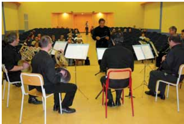
Prova del concerto dedicato alla festa della Repubblica

pubblici già esistenti, occorre dire invece che mancano ancora luoghi dove promuovere iniziative culturali a disposizione della Circoscrizione adeguati, per dimensioni e caratteristiche. Per questo si segue con attenzione e grande interesse la ristrutturazione degli ex Bagni pubblici di via Morgari, futura sede della Casa delle Culture, dove troveranno spazio le diverse associazioni che già adesso operano nel campo del protagonismo giovanile, inclusivo di tutte le etnie. Così come si segue con attenzione l'iter di acquisizione, da parte del Comune, dell'ex ospedale omeopatico di via Lombroso, dove dovrà trovare posto, tra le altre cose, una biblioteca, finalmente centrale rispetto al territorio, nella quale potranno convergere molte iniziative culturali.