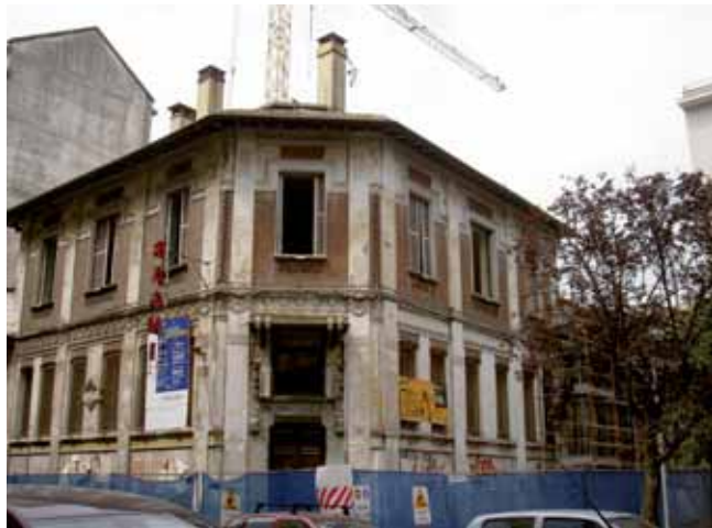
Dai bagni alla Casa delle Culture

Che la Circoscrizione 8 sia una realtà molto ricca dal punto di vista culturale, è un dato noto a coloro che ci vivono e che sono soliti praticare i luoghi dove la cultura si elabora e si fruisce. I molti che hanno scelto di vivere qui da sempre o che ci sono venuti di recente, sono pronti a testimoniare che questo è un posto vivace, pieno di belle iniziative, dove la gente si conosce e si saluta per la strada e nei negozi, dove un'iniziativa venuta da lontano come la "Festa dei vicini" ha subito avuto un successo che cresce ogni anno. E dove c'è un gran numero di persone che si raggruppano in associazioni con obiettivi e finalità che tendono a far vivere meglio i residenti, ma anche ad attirare su questo territorio persone provenienti da tutta la città e stranieri di passaggio. Quello che si vuole qui sottolineare è che quando si parla di San Salvario (ma in realtà questo è vero per tutta la circoscrizione) come di una realtà multietnica e fortemente inclusiva, ci si riferisce implicitamente al grande lavoro avviato anni fa per intrecciare le culture presenti e costruire un tessuto sociale nuovo creato da tutte le realtà sociali del territorio. Così sono nati o si sono proposti, con sempre maggiore peso e visibilità, anche spazi destinati alla cultura nelle sue diverse espressioni e origini etniche: musica, cinema, teatro, arte.