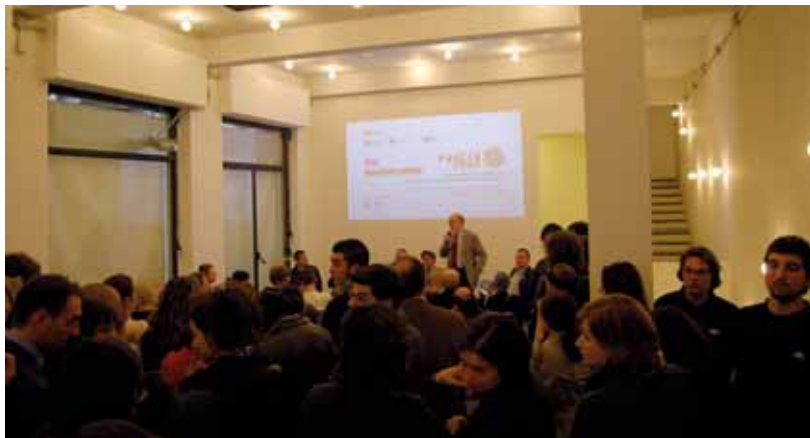
La festa per l'anteprima della Biennale dei Giovani Artisti

Nel cuore del quartiere di San Salvario, Artintown è una casa per la creatività e l'incontro multiculturale, un nuovo centro culturale per Torino.