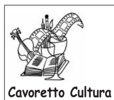
Il logo di CavorettoCultura