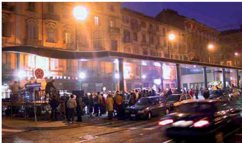
Un momento di festa in piazza Madama Cristina

A cura dell'Agenzia per lo Sviluppo Locale di San Salvario