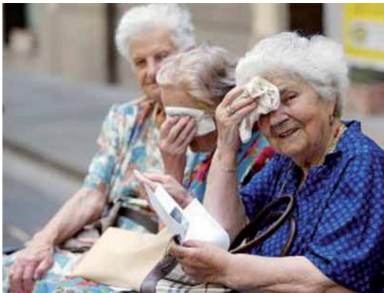
Emergenza caldo per gli anziani

sostegno (telefonate, aiuto a domicilio, visite di volontari e compagnia) rivolte soprattutto a coloro che non hanno appoggi familiari e si trovano in condizioni di maggiore disagio sociale e