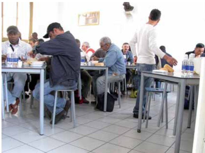
Gli ospiti della mensa condividono il momento del pasto

Da circa cento anni la mensa di via Brugnone, situata nei locali della parrocchia del Sacro Cuore di Gesù, in collaborazione con il Comune di Torino, offre il pasto ad un numero sempre crescente di adulti in difficoltà che si presentano a richiederlo: senza fissa dimora, persone uscite dal carcere, anziani non autosufficienti, tossicodipendenti ed alcolisti, stranieri e non, in attesa di occupazione o con altre forme di disagio non facilmente catalogabili. Sono presenti nella zona anche molte situazioni di povertà meno estreme e non ostentate che richiedono un'attenzione particolare per il rispetto della dignità che è dovuta a chiunque. Molte famiglie, infatti, non riescono ad arrivare alla fine del mese con lo stipendio o con il sussidio a loro disposizione e, allora, bussano alla nostra porta. A loro distribuiamo grazie al contributo dei servizi sociali della Circoscrizione 8, pacchi di viveri dato che la maggior parte di questi nuclei familiari ha al loro interno bambini/e o ragazzi/e in età scolastica ai quali dover garantire una sussistenza sufficiente. Questo servizio è reso possibile da una cuoca, una suora e da vo-