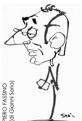
PIERO FASSINO