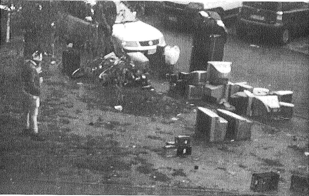
Piazzale San Pietro in Vincoli