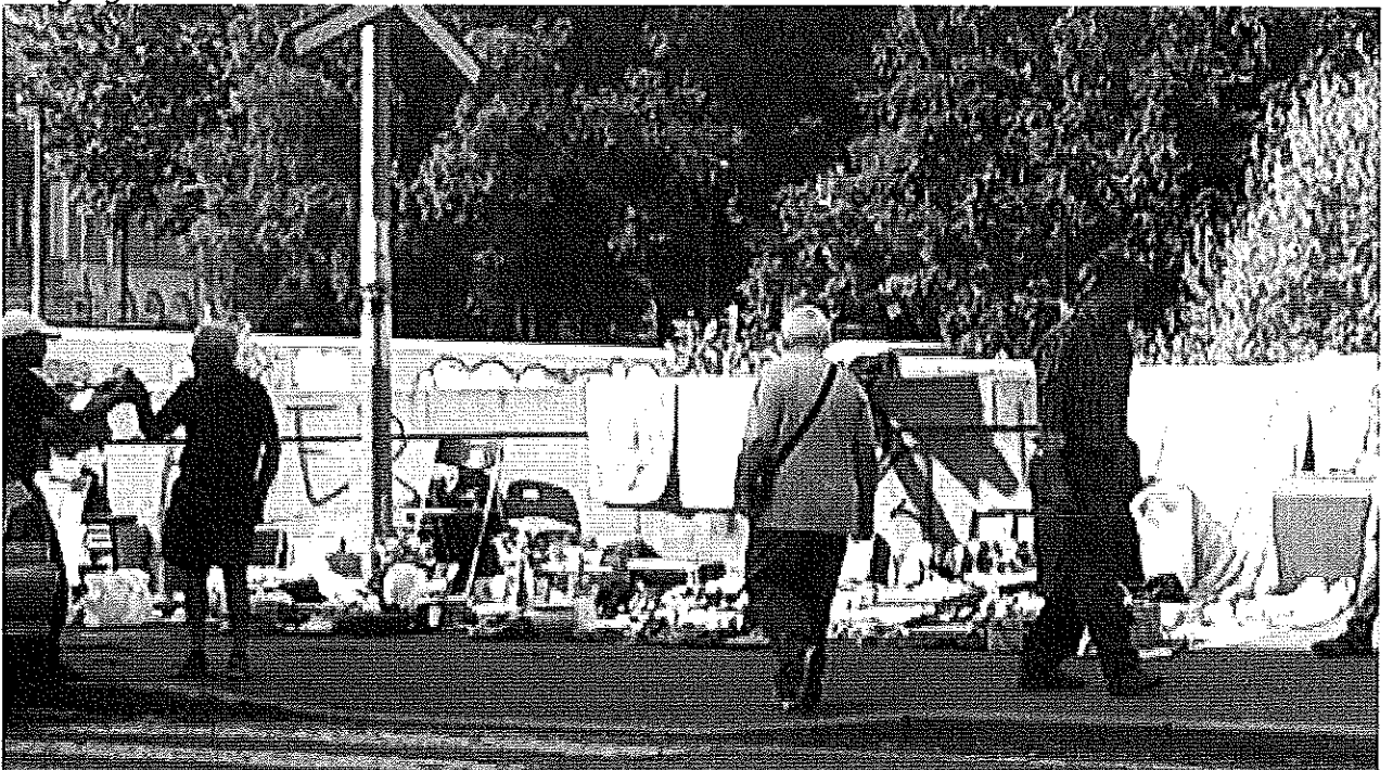
27 giugno 2015