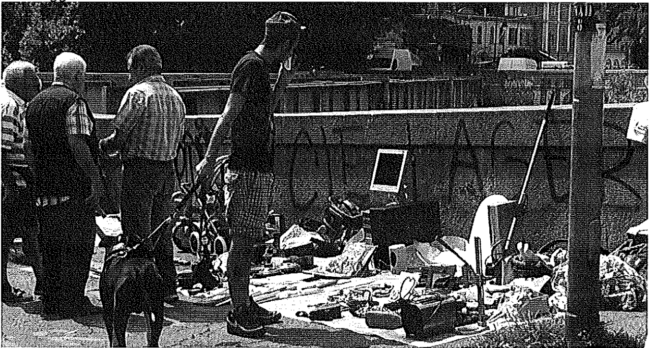
20 giugno 2015