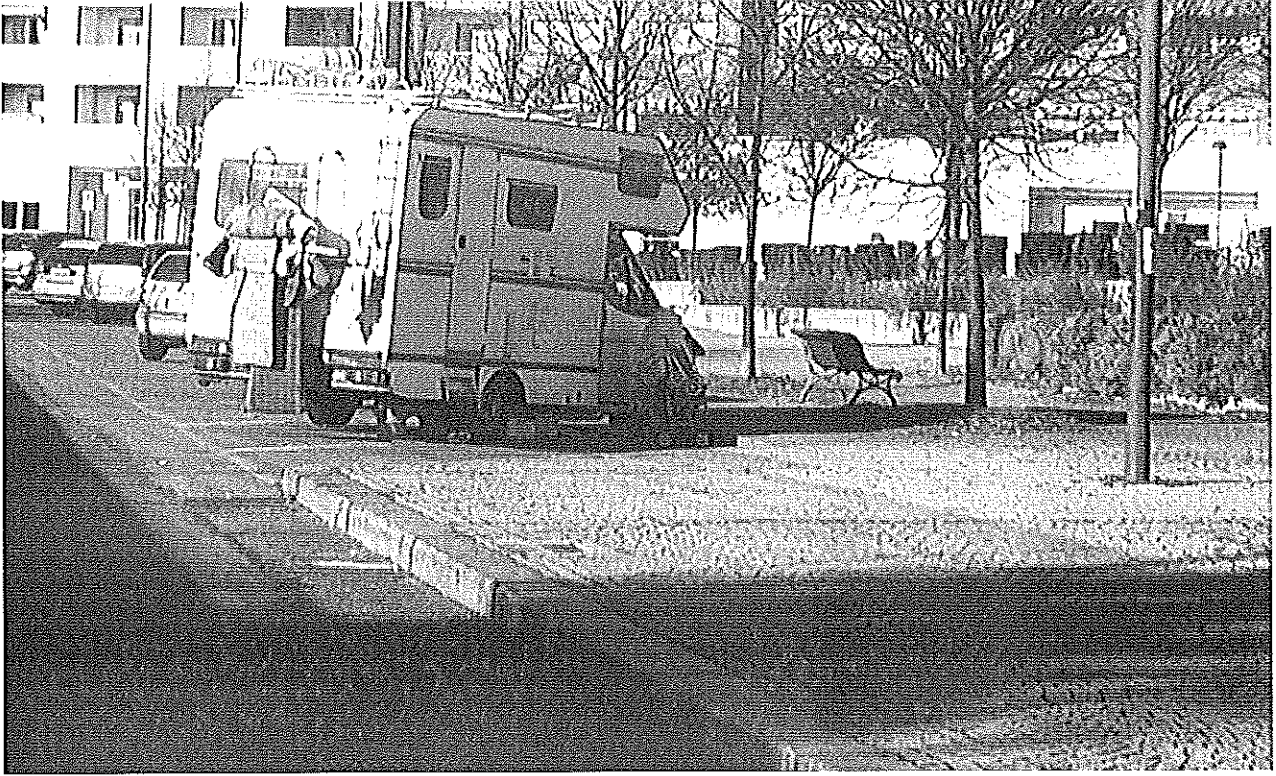
14 gennaio 2016 Camper "abitato" Via Saint Bon