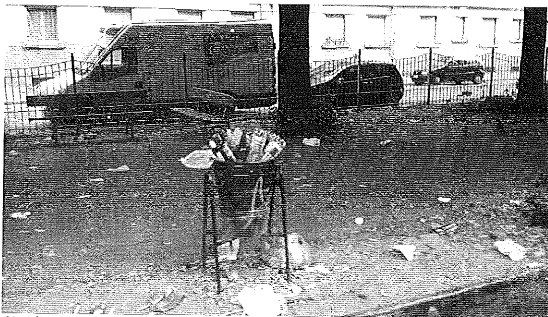
Giardino Alimonda fotografato dai residenti il 4 luglio 2017