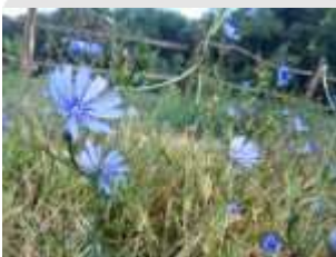
Il Parco in primavera

Inoltre passeggiando lungo le rotte ed i sentieri del Parco ci troviamo all'interno di uno dei più importanti siti di Rete Natura 2000: la rete di parchi e delle aree protette creata dall'Unione Europea per coordinare e collegare tra loro i diversi ambiti di tutela presenti in Europa per migliorare l'azione di salvaguardia delle risorse naturali.