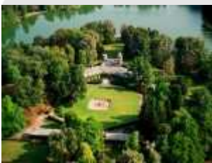
Castello dei Laghi

Il 21 agosto 1978 una legge regionale istituisce il Parco regionale La Mandria, con le finalità di salvaguardare, riqualificare e valorizzare l'unità ambientale e storica costituita dal Castello della Venaria Reale e dagli annessi "Quadrati", dal Castello de La Mandria, dalla Tenuta ex riserva reale di caccia, nonché dai singoli beni immobili e mobili che la compongono, aventi interesse di carattere storico, culturale ed ambientale; di promuovere e gestire ogni iniziativa necessaria od utile per consentire l'uso pubblico e la fruizione sociale, a fini ricreativi, didattici e scientifici, del territorio e dei beni immobili e mobili aventi interesse storico, culturale, ambientale e paesistico; di tutelare e riqualificare l'ambiente naturale nei suoi aspetti biologici, zoologici e botanici, geologici; di assicurare la più efficace azione protettiva e di valorizzazione nei confronti delle aree boschive; di promuovere ogni iniziativa necessaria o utile alla qualificazione delle attività agricole esistenti.