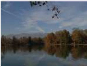
Cos'è il Parco

Il Parco La Mandria è un'importante realtà di tutela ambientale, in cui vivono liberamente diverse specie di animali selvatici e conserva il più significativo esempio di foresta planiziale presente in Piemonte. Istituito come "area protetta" regionale nel 1978, ha un nucleo centrale circondato da circa 30 km di muro di cinta e vanta un considerevole patrimonio storico-architettonico costituito da oltre 20 edifici tutelati tra cui il complesso del Borgo Castello , numerose cascine, i resti di un ricetto medievale e due reposoir di caccia.