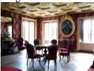
Appartamenti Reali di Vittorio Emanuele II