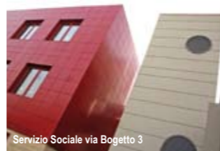
Servizio Sociale via Bogetto 3