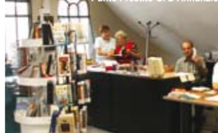
Punto Prestito G. D'Annunzio