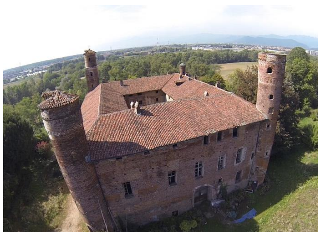
Veduta aerea del Castello del Drosso