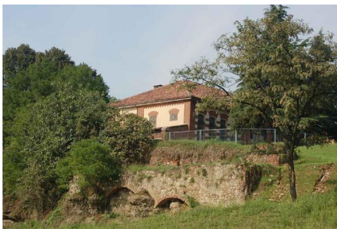
Castello di Miraflores, probabili resti in prossimità delle sponde del Sangone

Nel 1581 Jacopo di Savoia Duca di Nemours acquista una tenuta denominata Spinetta nei pressi del Sangone e costruisce una villa signorile, ceduta poi nel 1585 al duca di Savoia Carlo Emanuele I che farà iniziare i lavori per trasformare la villa in reggia per la moglie Caterina d’Asburgo. Nel 1602 prende la direzione ufficiale dei lavori Carlo di Castellamonte. Il palazzo viene denominato “Miraflores”, ovvero “ammira i fiori”. Il progetto ideale è descritto nel Theatrum Sabaudiae del 1666, che, però, non fu mai realizzato nella sua interezza.