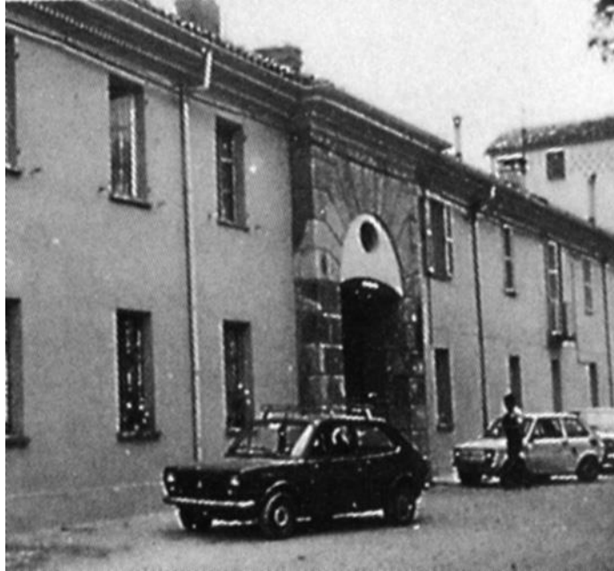
Cascina Mirafiori, primi anni 1980