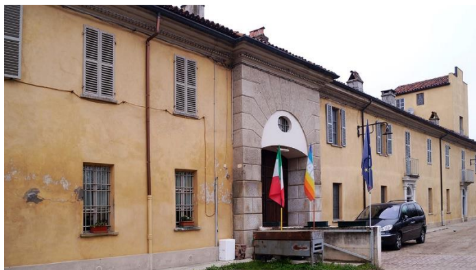
Cascina Mirafiori, 2015

La cascina Mirafiori sorgeva accanto all'omonima Reggia, di cui era pertinenza. Il fabbricato rurale fu rilevato nel Catasto particellare Gatti del 1820 come un corpo di fabbrica a pianta rettangolare composto da casa rustica, cortile e giardino.