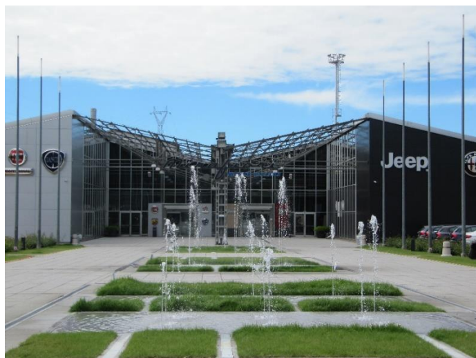
Mirafiori Motor Village, 2017