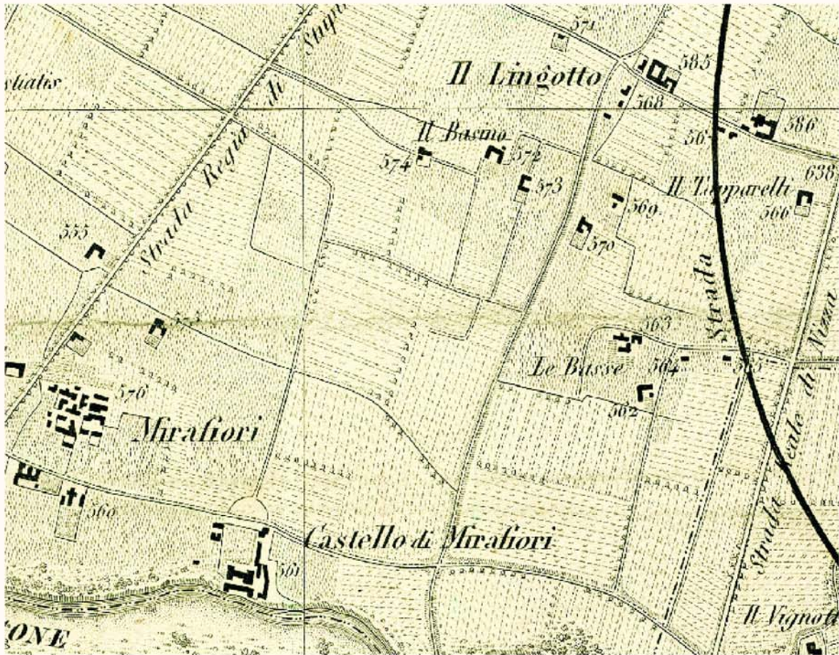
A.S.C.T. Tipi e Disegni 64.8.5 particolare e mappa