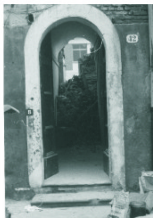
L'ingresso del rifugio antiaereo

Una scossa sismica, durante il terremoto del 30 gennaio 1980, fa crollare il campanile e sventra parte del convento.