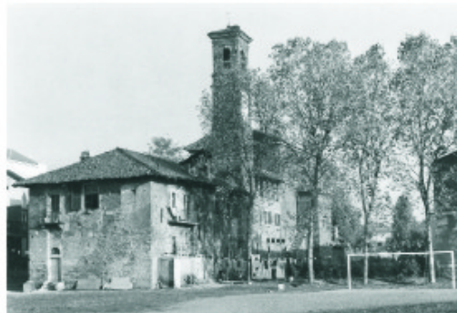
Il convento e il campanile prima del terremoto del 1980

Presso l'altare di questa cappella viene sepolta la contessa di Mirafiori, Rosa Vercellana detta la "Bela Rosin", il cui blasone è dipinto sul soffitto.