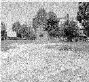
I giardini di corso Ferrucci

Erba alta alternata ad ampie zone spelacchiate, poche panchine e nessun gioco per bambini. Versa in pessime condizioni il giardino intitolato agli artiglieri di montagna all'angolo fra corso Vittorio e corso Ferrucci.