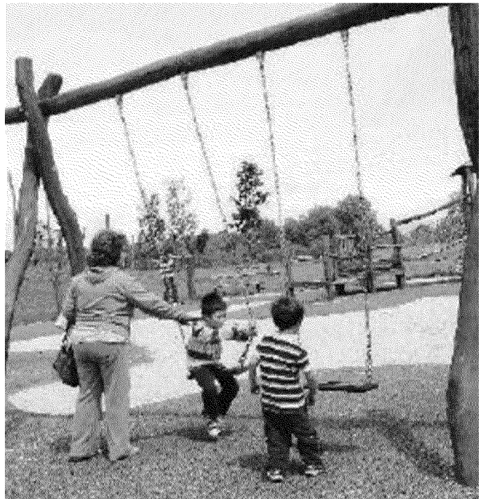
I giochi del parco da poco inaugurato all'Arrivore

A pochi passi dal ponte Amedeo VIII e da strada Settimo, l'area da tempo ha dovuto fare i conti con la difficile convivenza con i rom. I contadini assegnatari degli orti, negli anni scorsi arrivarono a rifiuta-