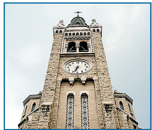
Santa Rita avrà degli elevatori per i disabili

→ Stanziati 2 milioni di euro per interventi nei luoghi di culto. Lo ha deciso ieri la giunta comunale. Fra i lavori che saranno finanziati, l'abbattimento delle barriere architettoniche per il tempio israelitico di piazzetta Primo Levi e per le parrocchie Patrocinio San Giuseppe di via Baiardi e Santa Rita da Cascia di via Vernazza, dove saranno anche installati elevatori per disabili. Alcune parrocchie utilizzeranno il contributo per mettere a norma gli impianti all'interno delle chiese, altre per restaurare la facciata o decorazioni interne. Sarà ristrutturata anche