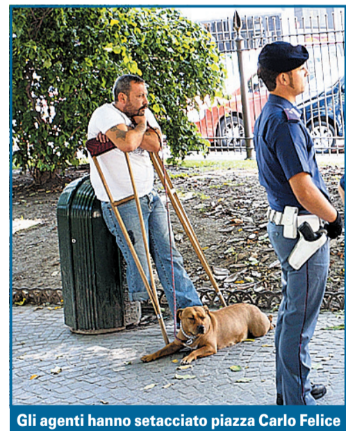
Gli agenti hanno setacciato piazza Carlo Felice

nei pressi di Porta Susa. In totale sono state controllate un centinaio di persone. Anche nel tratto di strada che collega piazza Statuto e la stazione secondaria della città, gli agenti hanno proceduto al fermo di altre persone straniere che non erano in possesso di documenti di identità. Questo genere di controlli vengono effettuati sull'intero territorio cittadino, dai commissariati di competenza, con cadenza quotidiana ed è anche grazie a questo genere di operazioni, diventate ormai di routine, che i reati a Torino sono sensibilmente diminuiti, specie nelle ore diurne, quando i controlli delle forze dell'ordine, polizia e carabinieri, sono diventati più stringenti e da essi è difficile sfuggire.