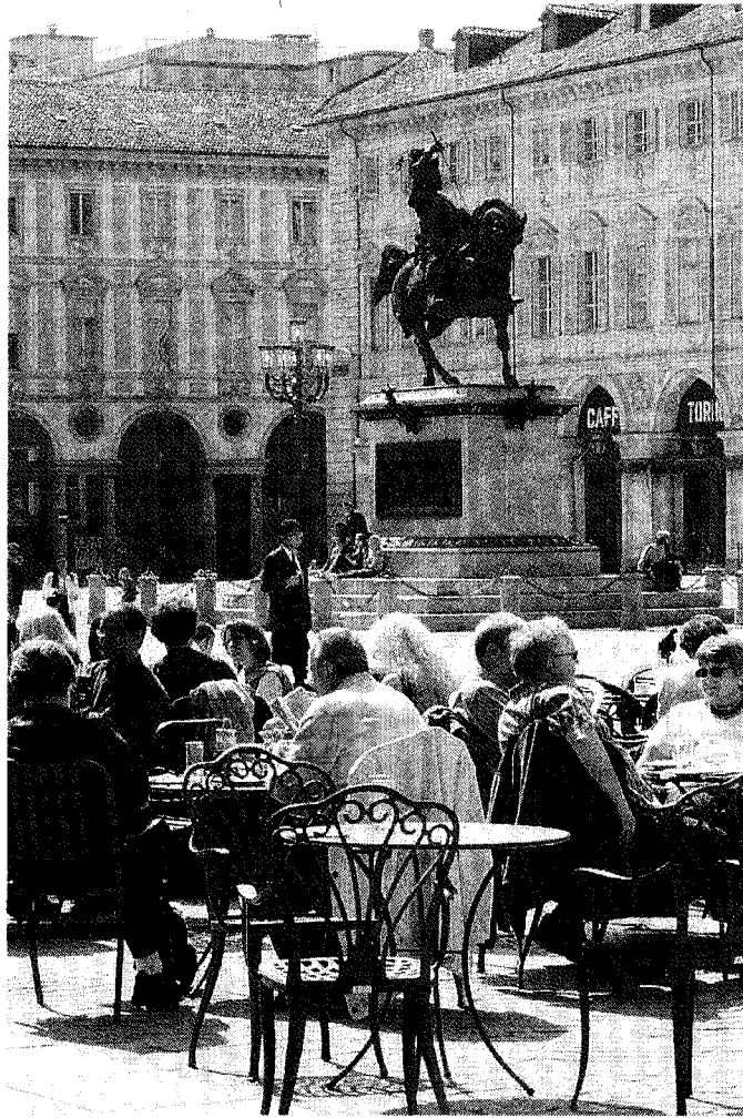
Una veduta di piazza San Carlo