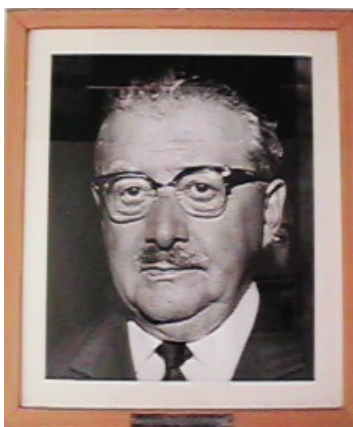
Dal Palazzo Civico, 31 gennaio 1964. ANSELMETTI CAV. DI GRANCROCE DOTT. ING. GIOVANNI CARLO Sindaco di Torino dal 26 Febbraio 1962 al 21 Ottobre 1964

Mi auguro che l'opera venga bene accolta dalla cittadinanza ed in particolare dai padri coscritti che nel palazzo svolgono la loro utile e proficua opera di democrazia e di civile progresso.