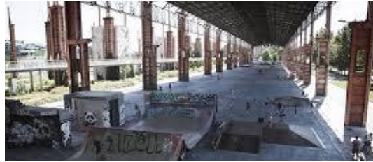
Skate Park Parco Dora