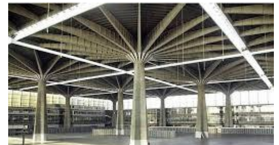
Ex Palazzo del lavoro