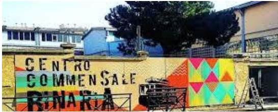
Centro Commensale Binaria