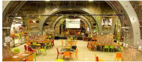
Murazzi Student Zone