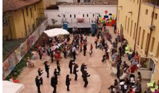
Casa del quartiere