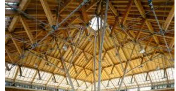
Cortile del Maglio