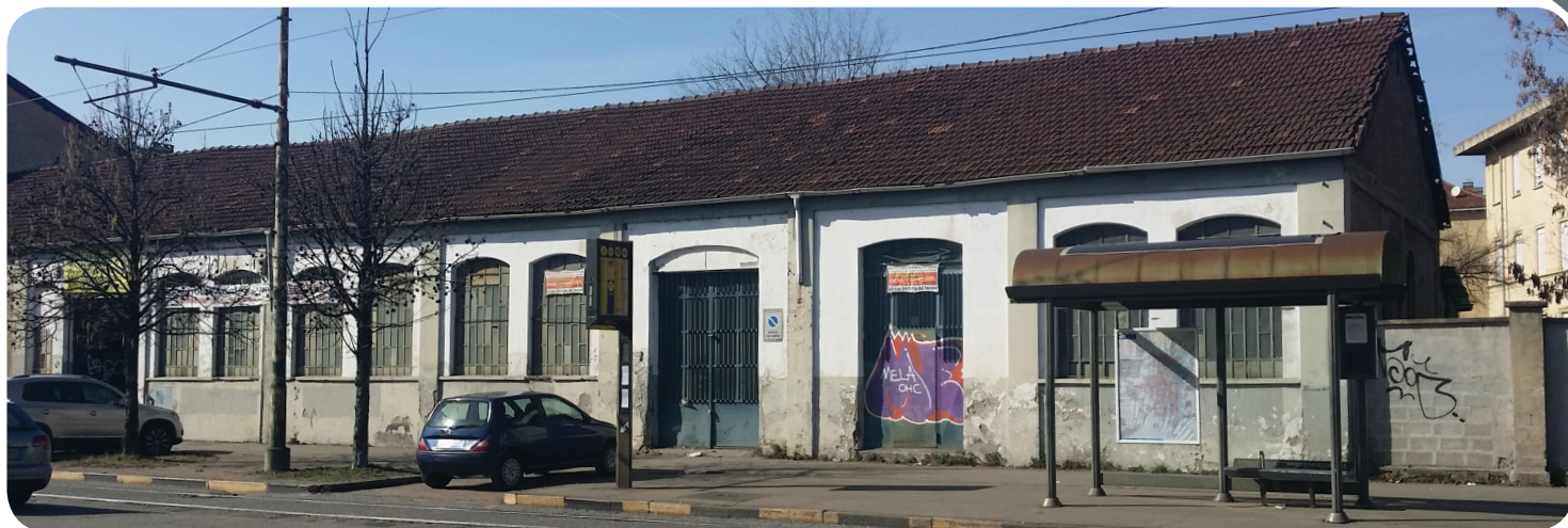
IL COMPLESSO DI FABBRICATI DI VIA BOLOGNA