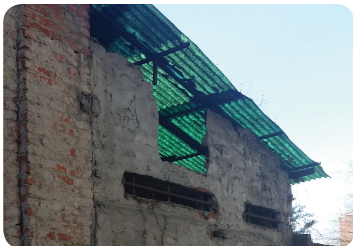
DETTAGLIO DELLE TETTOIE