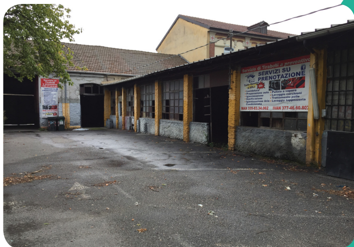
CORTILE INTERNO E MANICA N. CIVICO 175