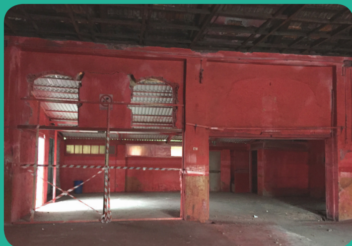
INTERNO MANICA N. CIVICO 177