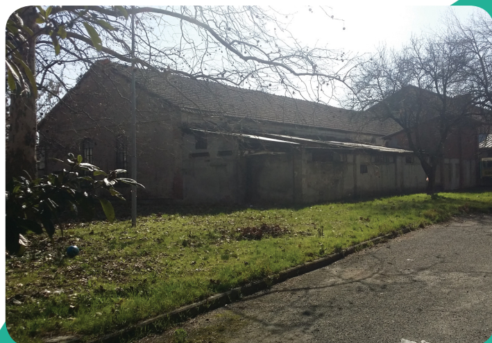
VISTA DELL'EDIFICIO DAL CORTILE DELLA SCUOLA ADIACENTE